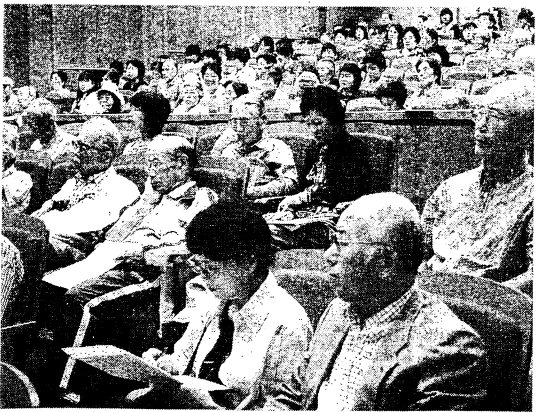
市民に聞き入る市民

第一回「市民公開健康講座」の様子はこちらでご覧いただけます。→ URL: http://www.kcn.jp/kenko